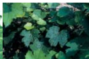
Acarien de l'érinose de la vigne