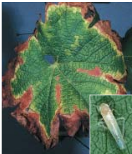
La Cicadelle des grillures

d'abord cultivée au Moyen-Orient puis en Palestine et autour du Bassin méditerranéen pour son fruit et la production de vin, comme en témoigne un passage de la Bible qui rapporte que Moïse en-