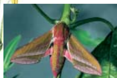
Grand sphinx de la vigne - imago