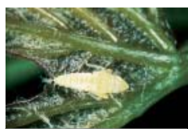
Cicadelle des grillures